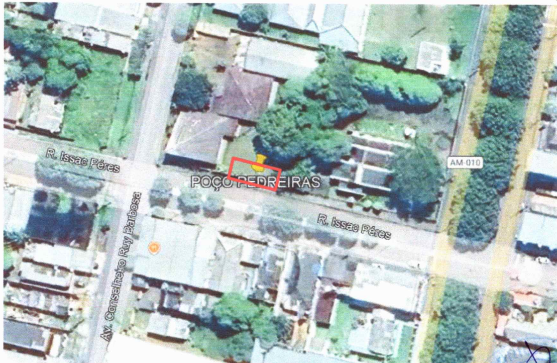
Figura 3 – Imagem de satélite da área do terreno.