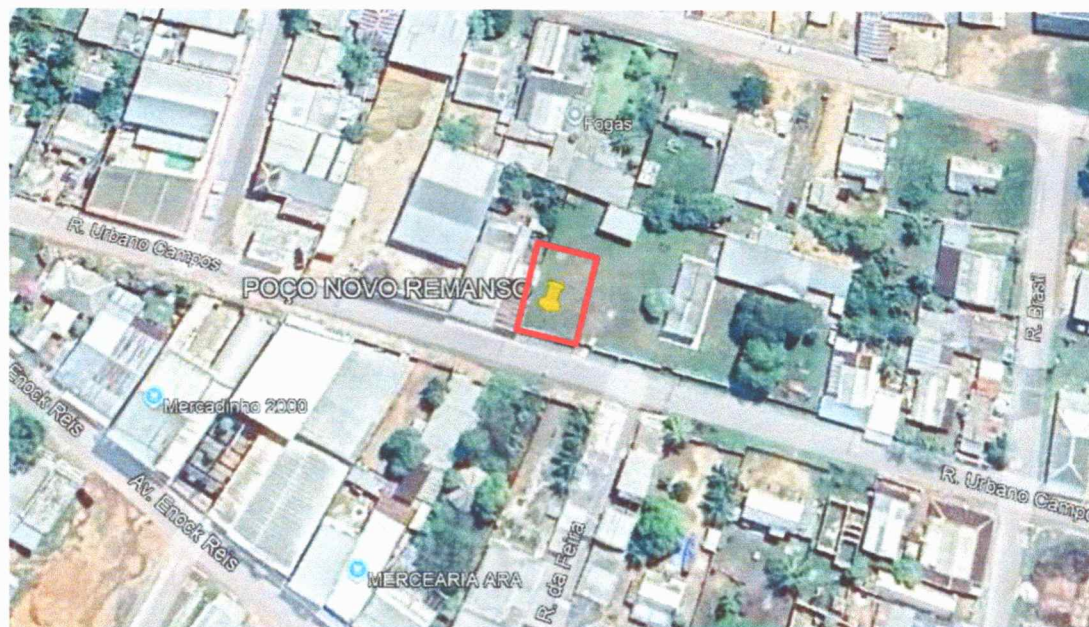
Figura 5 – Imagem de satélite da área do terreno.