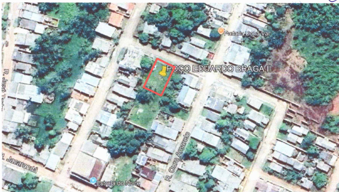
Figura 4 – Imagem de satélite da área do terreno.