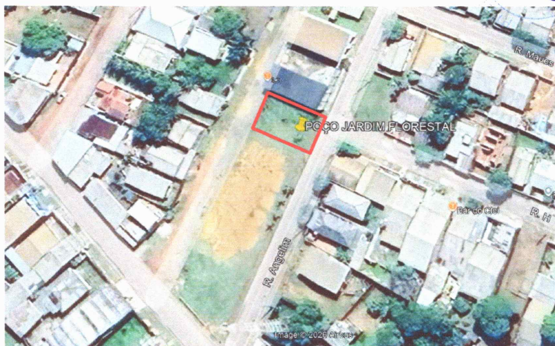
Figura 2 – Imagem de satélite da área do terreno.