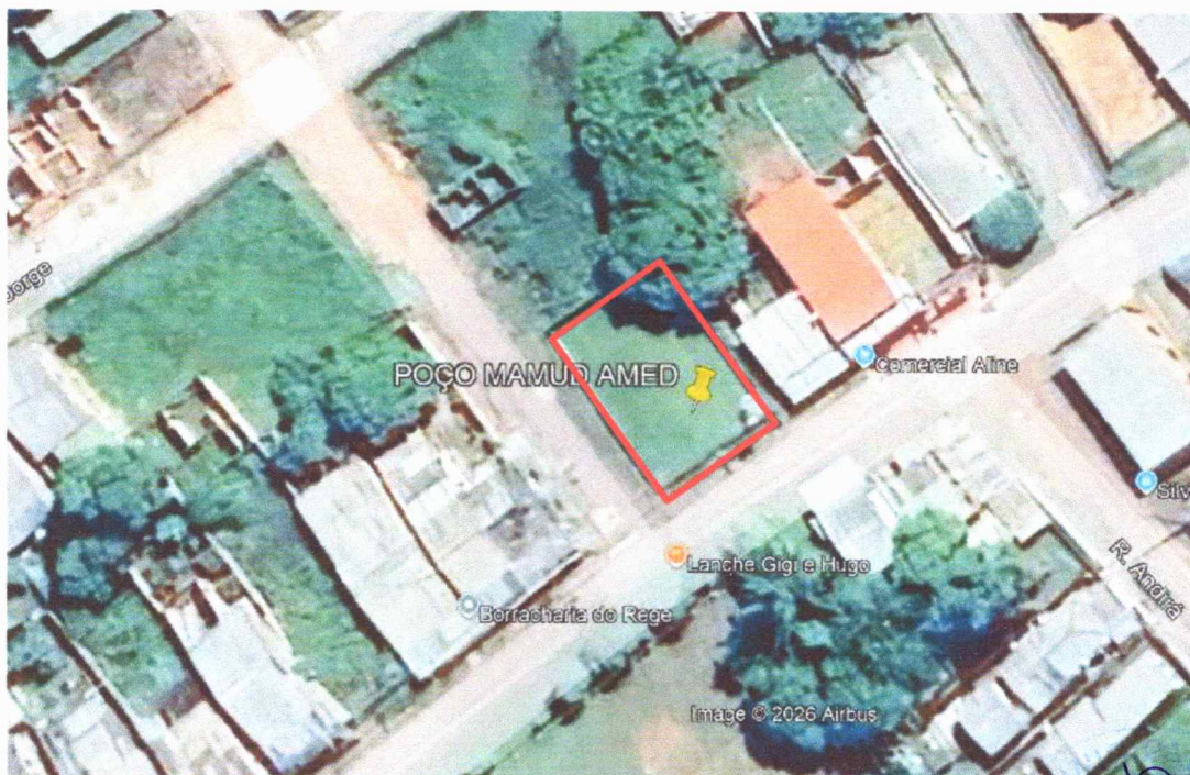
Figura 1 – Imagem de satélite da área do terreno.